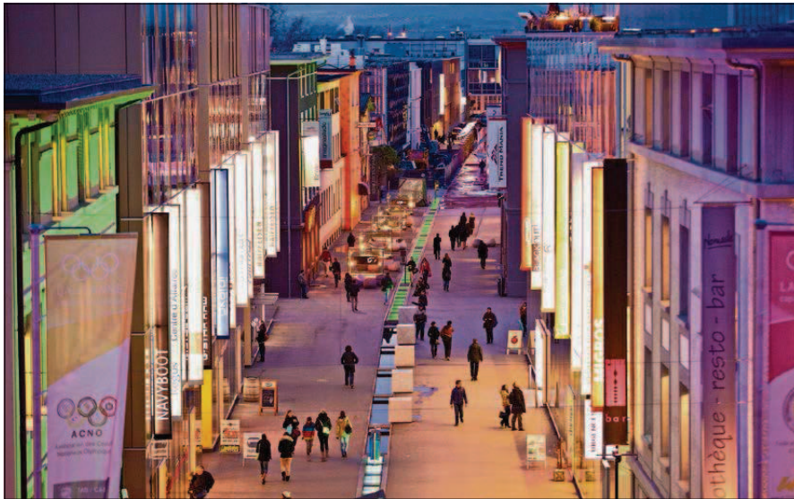
Le quartier du Flon se définit comme un lieu de vie diurne et nocturne. Il draine environ 7,5 millions de personnes par an.